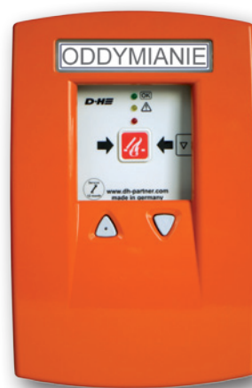
Centrala oddymiania RZN 4503-T