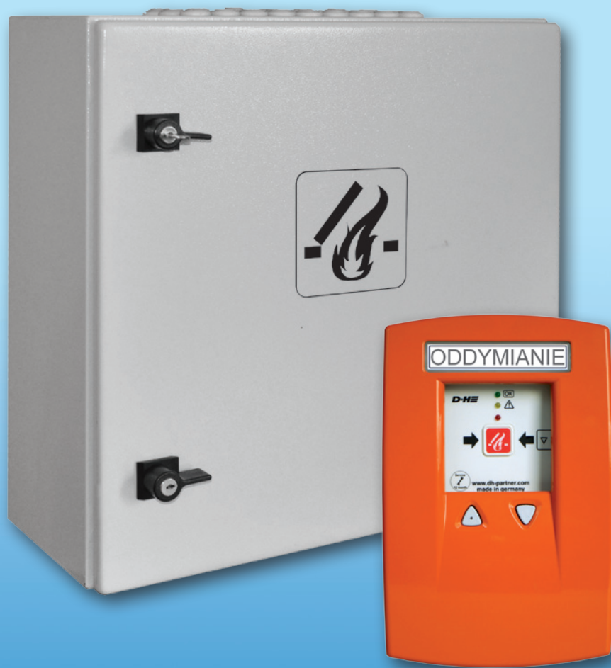
Moduł do sterowania wentylatorami FCP 401