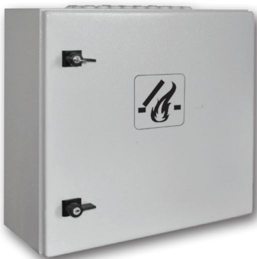
Moduł do sterowania wentylatorami FCP 401

* dotyczy rozwiązań nietypowych (układy hybrydowe)